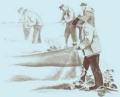
Fischer auf Reusenplatz