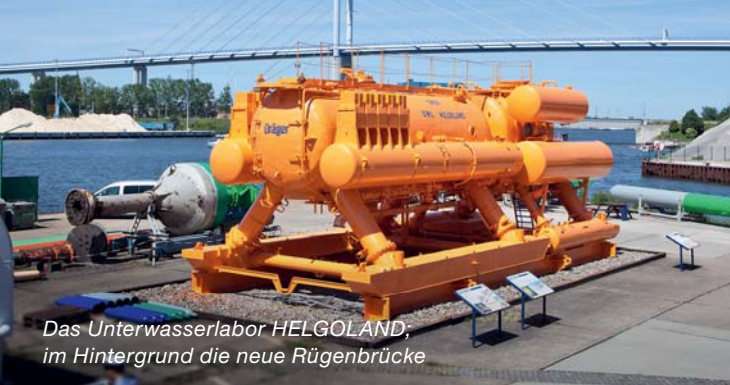
Das Unterwasserlabor HELGOLAND; im Hintergrund die neue Rügenbrücke