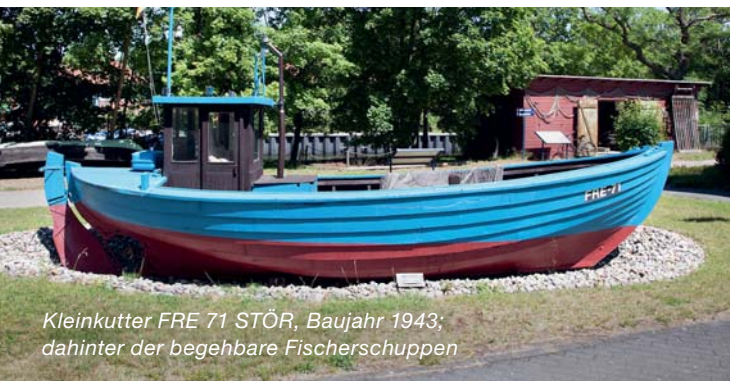
Kleinkutter FRE 71 STÖR, Baujahr 1943; dahinter der begehrte Fischerschuppen