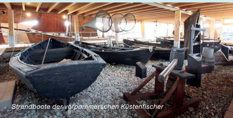
Strandboote der vorpommerschen Küstenfischer

Weitere Informationen über die Ausstellungen im NAUTINEUM finden Sie unter nautineum.de .