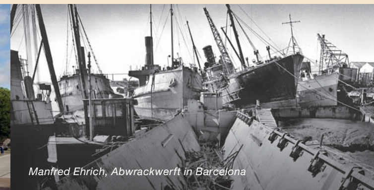
Manfred Ehrich, Abwrackwerft in Barcelona