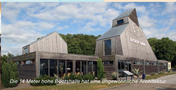
Die 14 Meter hohe Bootshalle hat eine ungewöhnliche Architektur