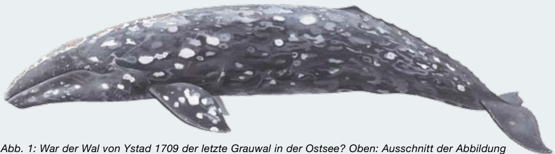
Abb. 1: War der Wal von Ystad 1709 der letzte Grauwal in der Ostsee? Oben: Ausschnitt der Abbildung des Einblattdruckes von 1709. Unten: Grafik eines rezenten Grauwales (Pieter Folkens).