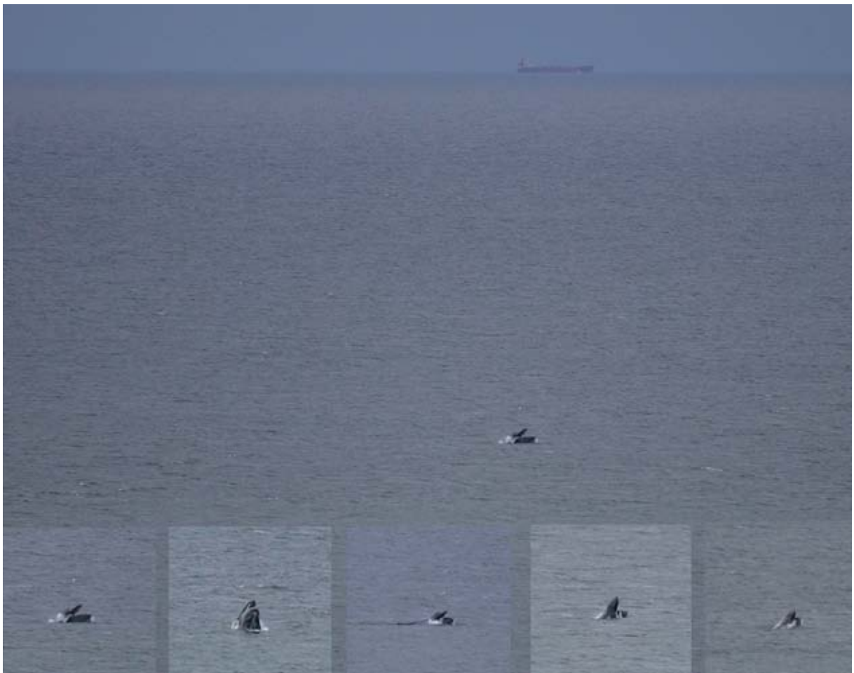
Abb. 12: Am 25. Juli 2008 beobachteten und fotografierten Ornithologen den Buckelwal vor Kap Arkona, wie er mit geöffnetem Maul in einem Fischschwarm Nahrung aufnahm.

2008 hielt sich über mehrere Wochen ein sehr abgemagertes Tier in der westlichen Ostsee und dem Kattegat auf. Sein „Schwimmpensum“ in der westlichen Ostsee wurde in vorbildlicher Kooperation zwischen dänischen, deutschen,