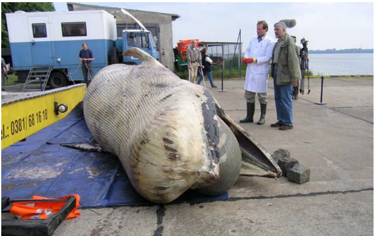
Abb. 3: Ein adultes Zwergwal-Weibchen in fortgeschrittener Verwesung aus der Lübecker Bucht wird am 7. Juni 2004 von den Autoren Benke und Schulze begutachtet.