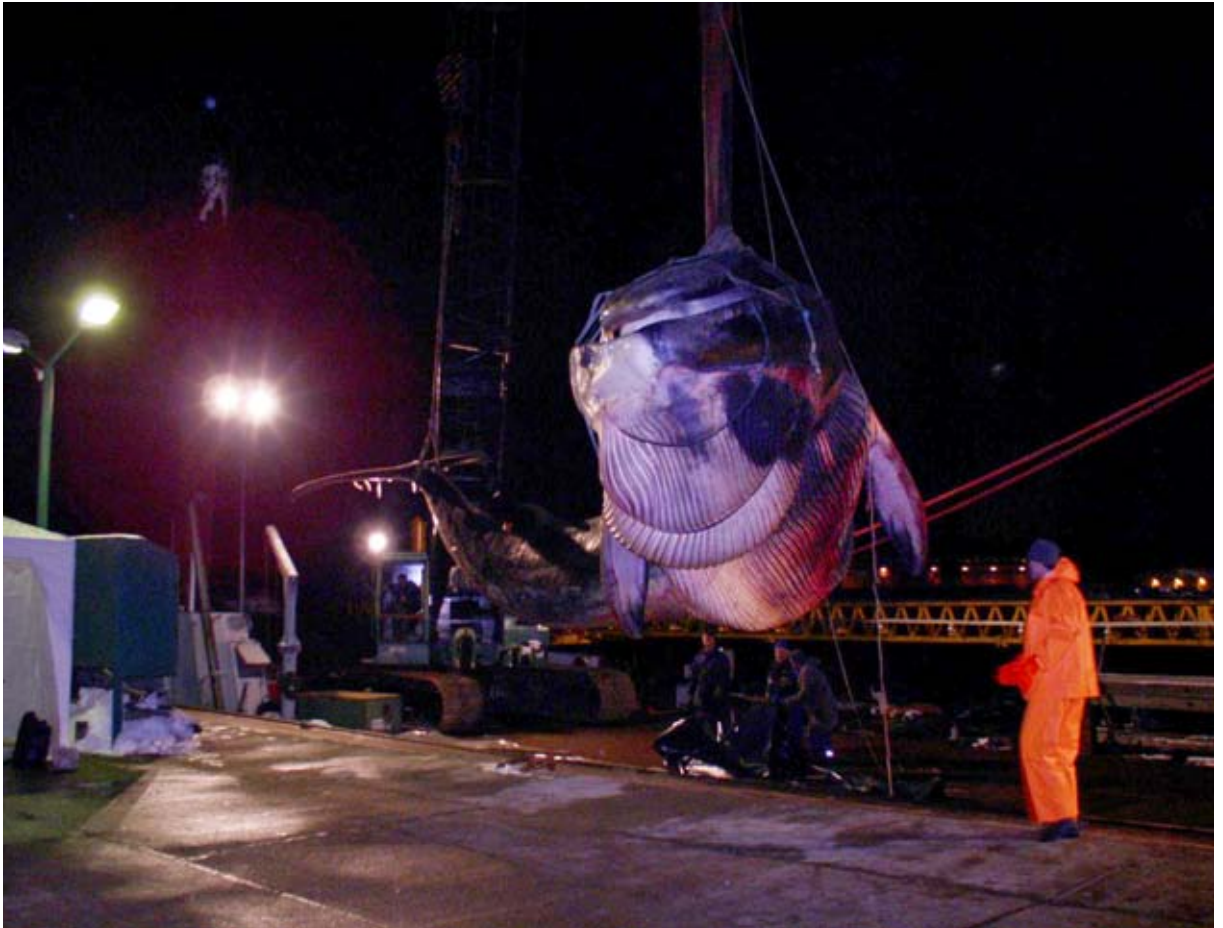
Abb. 8: Der Finnwal wird am 18. Januar 2006 zur Sektion auf dem Gelände des NAUTINEUMs Dänholm abgeladen.

nebenbei für die Herstellung eines aufblasbaren Walmodells exakt vermessen werden. Die Gelegenheit nutzend, brachte Greenpeace den Kadaver aber nach Berlin vor die Japanische Botschaft, um dort gegen den japanischen Walfang zu demonstrieren. Das Medienecho war enorm; über keinen anderen Großwal wurden so viele Fernseh- und Rundfunkbeiträge gesendet. Zum ausgemachten Termin kam der tote Wal am 18. Januar in Stralsund an und bei klirrender Kälte begannen Mitarbeiter des Meeresmuseums und Studenten aus Greifswald und Rostock am nächsten Tag mit der Untersuchung des Kadavers (Abb. 8). Alle 20 Minuten konnte sich eines der drei Bearbeiter-Teams im Wärmzelt erholen. Das stark abgemagerte Tier wurde innerhalb eines Tages seziiert.