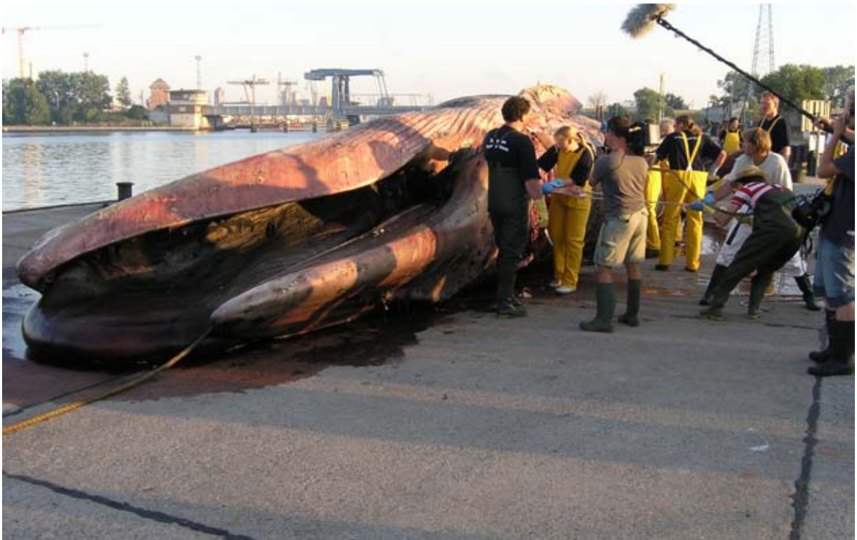
Abb. 7: Unter großem Medieninteresse erfolgte schon früh am Morgen des 12. Juli 2005 auf dem Gelände des NAUTINEUMs Dänholm die Sektion des Finnwales. Hier wird die dicke Speckschicht entfernt.

Der Kadaver wurde von einem Angler auf der Sandbank Lieps in der Wismarbucht entdeckt. Wegen des Eisganges konnte der Kadaver auf dem Wasserwege nur bis Rostock transportiert werden. Die Umweltorganisation Greenpeace e. V. bot sich an, den Transport von Rostock nach Stralsund über Land mit einem Sattelschlepper zu übernehmen. Der Finnwal sollte