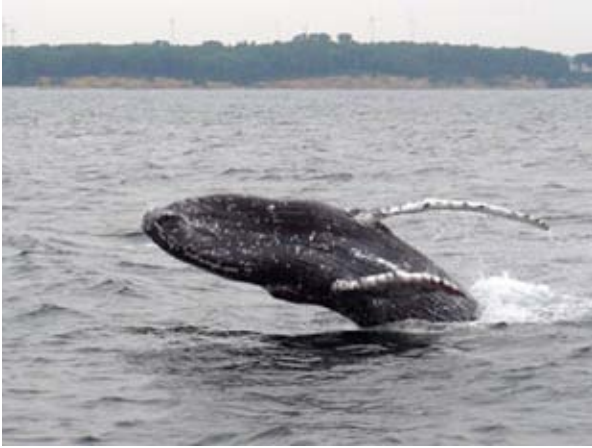
Abb. 14: Buckelwal „Bucki“ am 18. August 2008 in der Lübecker Bucht vor Grömitz (Schleswig-Holstein). Am 19. August 2008 erschien darüber ein Artikel in der Ostsee-Zeitung mit dem Titel: „Bucki übt fliegen“.

polnischen und schwedischen Walforschern aufgezeichnet. Ein Vergleich zum Buckelwal von 1978 veranschaulicht die immense Veränderung in der Medienlandschaft, die seitdem stattgefunden hat und wie über das Auftreten eines seltenen großen Wales in der Ostsee im Abstand von 30 Jahren berichtet wurde.