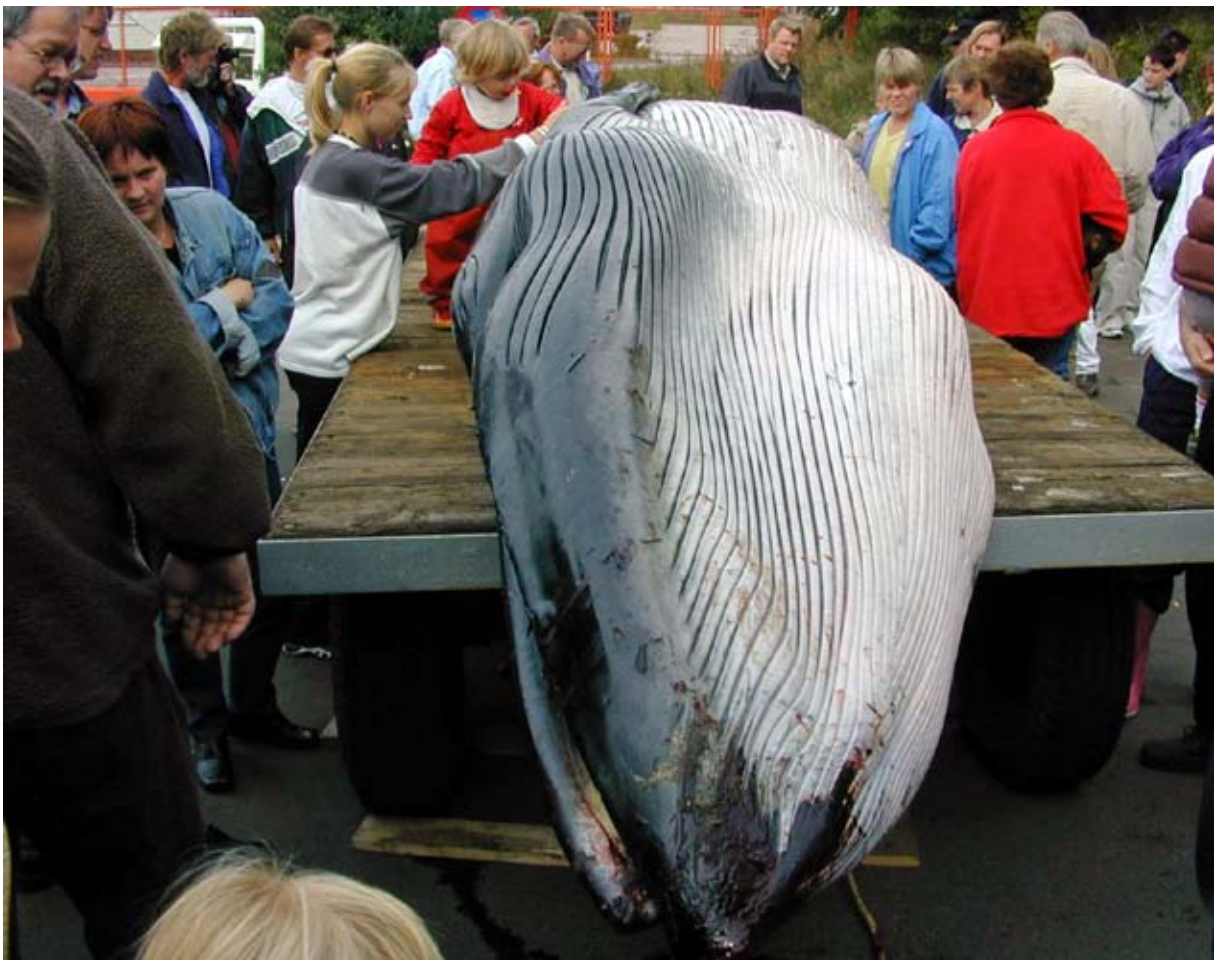
Abb. 4: Der Brydewal von Kyndby wurde Anfang September 2000 öffentlich zur Schau gestellt. Etwa 12 000 Menschen sahen ihn.

Periodisch gibt es aber offenbar auch ein Vorkommen weiter nördlich. Der dänische Fund scheint auch nicht der erste gewesen zu sein. In seiner Übersicht aus dem Jahre 1991 erwähnt Gerhard Schulze einen Finnwal aus dem Jahre 1944 von der mecklenburgischen Küste bei Poel. Anhand eines recht guten Fotos lassen sich drei Wülste auf dem Kopf erkennen, die ein gutes Merkmal für Brydewale sind. Es wird sich hierbei nicht um einen Finnwal, sondern um einen Brydewal gehandelt haben.