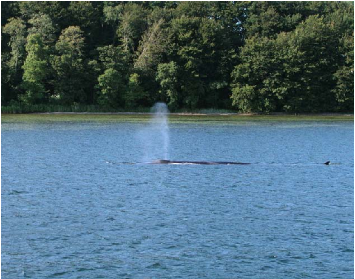
Abb. 5: Finnwalsichtung im nördlichen Kleinen Belt bei Børup Sande im Jahr 2003.

Der Wal schwamm hiernach wieder eine Tour nach Norden und am 6. Januar sichtete man ihn wieder im nördlichen Kleinen Belt. Am 10. Janu-