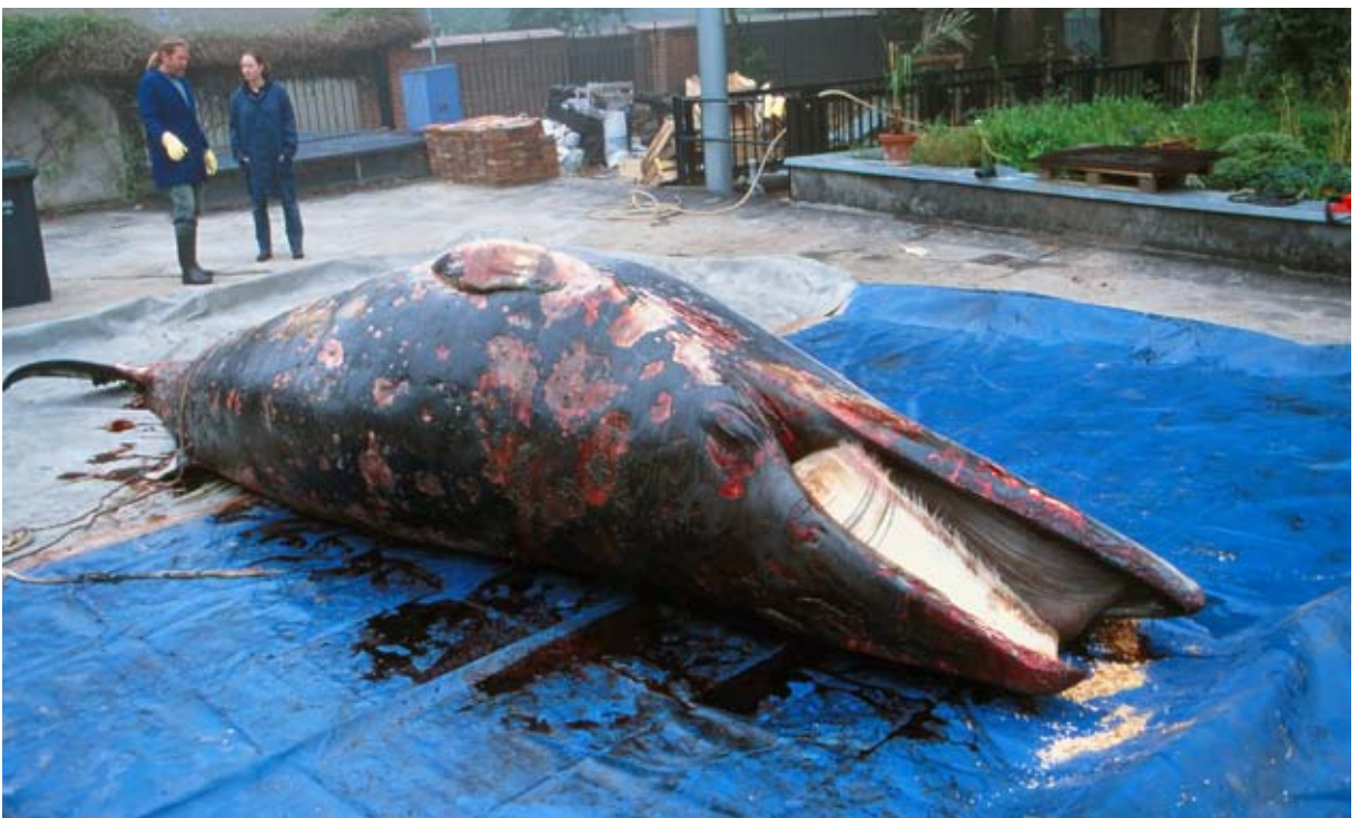
Abb. 1: Auf dem Südhof des Deutschen Meeresmuseums beginnen am 1. Juli 1999 die Vorbereitungen zur Sektion des Zwergwales.

Es ist nicht auszuschließen, dass es sich hierbei um das Ende Mai bei Wismar verendete Tier gehandelt hat.