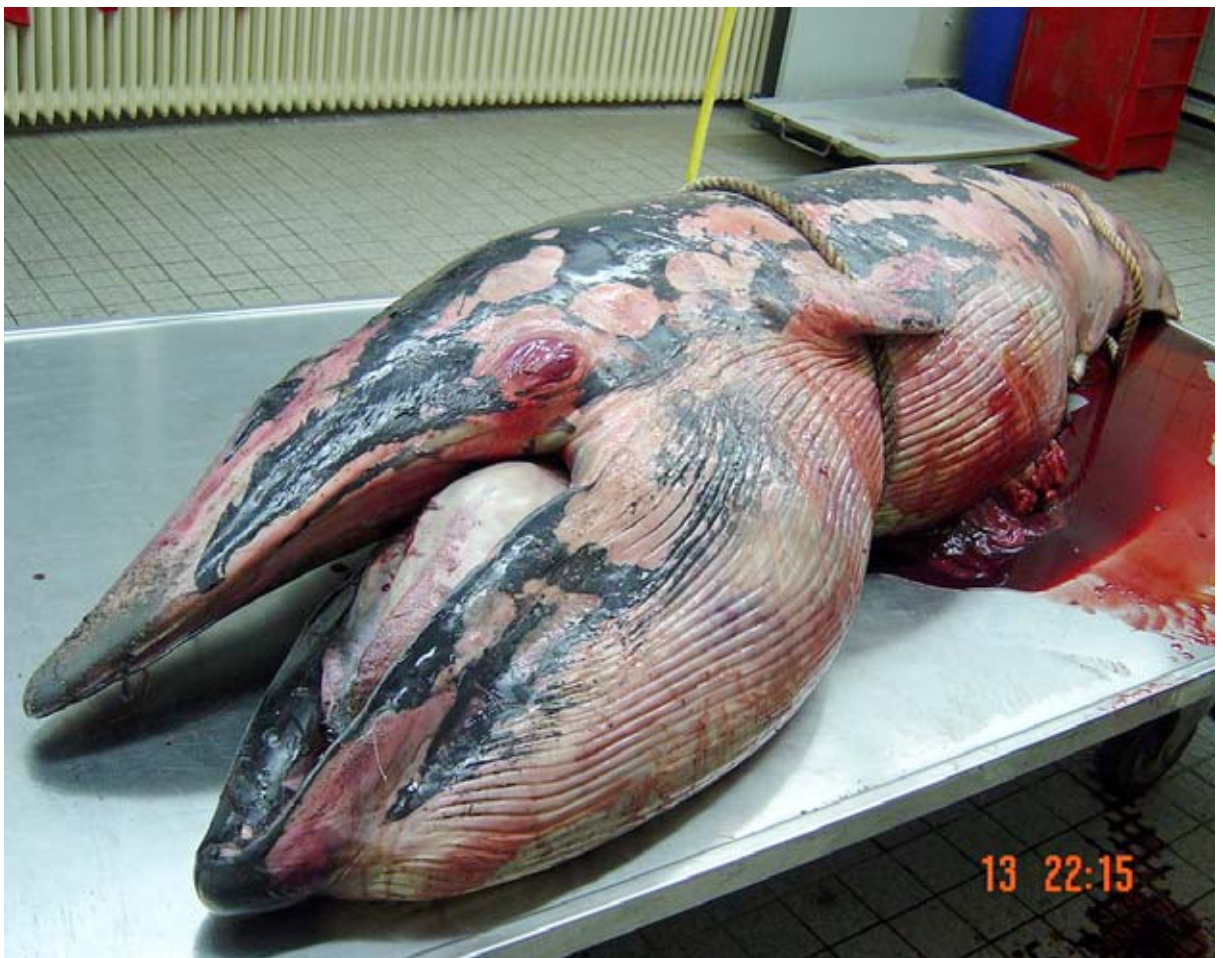
Abb. 6: Der 2003 beim Weißenhäuser Strand gefundene Finnwal fötus.

Zeitung bereits auf „Finni“ getauften Wal zum Dänholm. Die Bergung des riesigen Tieres war aufgrund des Gewichtes von 40 bis 50 Tonnen äußerst schwierig. Zu dem Zeitpunkt war gerade die neue Strelasundbrücke in Bau. Zwei große Schwimmkräne der Brückenbaufirmen erklärten sich zur Hilfe bereit und hievten die Last auf die Kaikante im NAUTINEUM. Bei der Aktion gingen die durch die Verwesung schon vom Oberkiefer gelösten Barten verloren. Taucher holen diese am nächsten Tag aus dem Sund. Um eine Explosion des Kadavers zu vermeiden, wurden mit Hilfe einer Sonde die Fäulnisgase aus dem Körperinneren abgeleitet. Am 12. Juli erfolgte an diesem heißen Sommertag ab 5 Uhr die Sektion (Abb. 7). Zunächst wurde mit Flensmessern die dicke Speckschicht abgetrennt und dann das Muskelfleisch entfernt. Die Organe wurden herausgetrennt und Proben für weitere Untersuchungen entnommen. Die Knochen kamen zur Mazeration in einen vom Deutschen Meeresmuseum eigens dafür gebauten Großcontainer auf dem Gelände der Stralsunder Kläranlage. Hilfe haben die etwa 15 Mitarbeiter des Deutschen Meeresmuseums von Gabelstaplern und