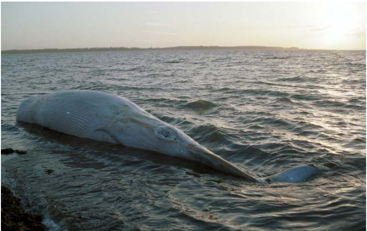
Abb. 2: Zwergwal-Weibchen am 9. Januar 2000 am Strand von Tybrind Vig nördlich von Assens.

Am 28. Mai 2003 verding sich ein Zwergwal in einem Seehasen-Netz bei Sjællands Odde, Seeland, und einige Tage später am 4. Juni in einem Bundgarn bei Skagen. Mitarbeiter von Danmarks Miljøundersøgelse (Dänischen Umwelt-Untersuchungen) wurden herbeigerufen und konnten im Verlaufe der Befreiung des Tieres einen Satellitensender anbringen, um die Wanderungen des Tieres zu verfolgen. Es ergaben sich ganz neue Befunde zu Schwimmdistanzen und Aufenthaltsorten eines Zwergwales. Das Tier nahm zunächst Kurs auf den Oslo Fjord, umrundete