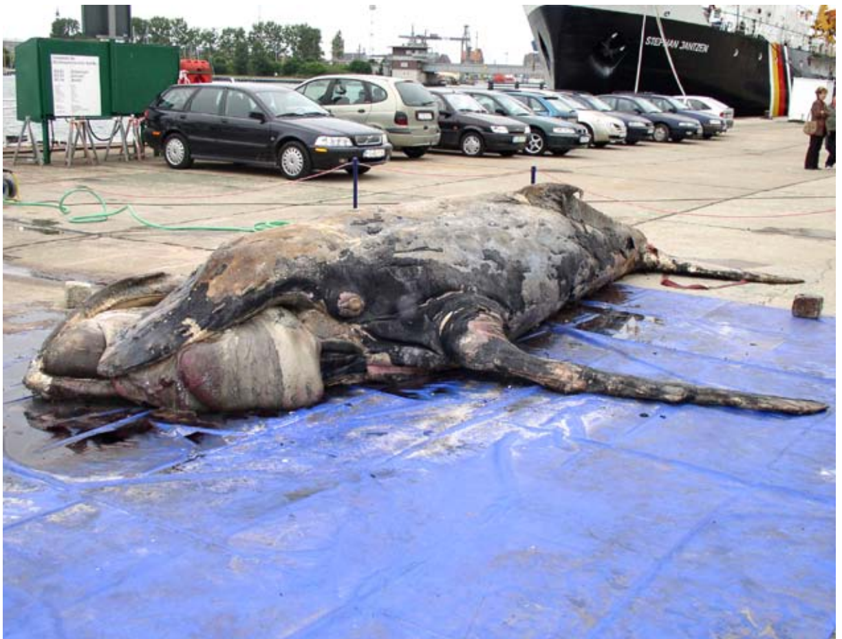
Abb. 11: Der stark verwesene junge weibliche Buckelwal, gefunden am 3. Juli 2003 in der Lübecker Bucht, ist kaum noch als solcher zu erkennen. Er ähnelt eher einem „Meeresungeheuer“ oder einem „Alien“ von einem anderen Planeten.

Scheinbar ohne vorherige Sichtungen wurde am 3. Juli 2003 ein junger weiblicher Buckelwal von Strandwanderern am Strand von Groß Schwansee in der Lübecker Bucht treibend aufgefunden. Mit der Firma Abschlepp-Harry wurde der Kadaver nach Stralsund zum NAUTINEUM Dänholm transportiert. Dort erfolgte am 7. Juli die Sektion des Tieres (Abb. 11). Seine Gesamtlänge betrug 6,04 Meter und die Speckdicke 6,2 bis 7,5 Zentimeter.