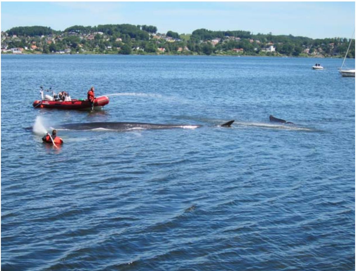
Abb. 9: Lebend-Strandung eines Finnwales im Vejle Fjord 2010.

Am 21. Juni 2009 gegen 3 Uhr wurde ein möglicher Finnwal an der schwedischen Schärenküste gesichtet, er wurde etwa 50 Kilometer