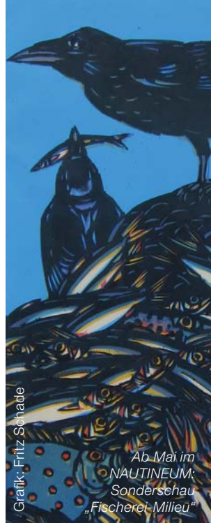
Grafik: Fritz Schade